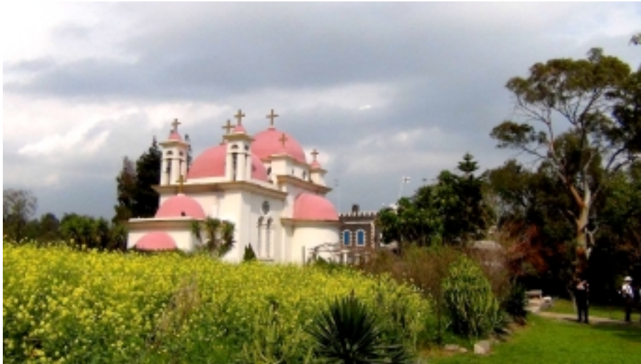
Eglise orthodoxe à Capharnaïm