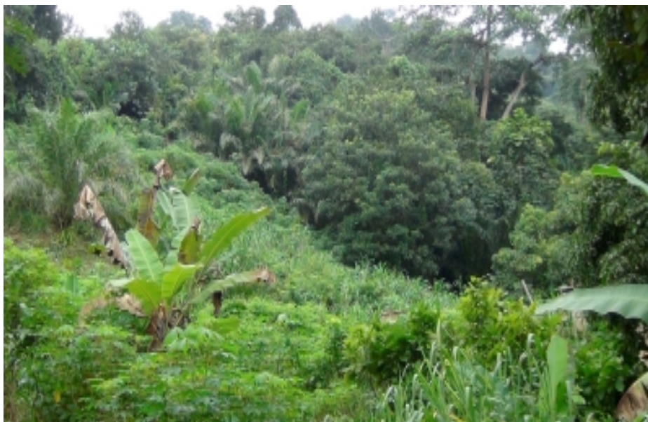
Dans la forêt d'Agomé, Togo

("L'isolement", Méditations poétiques, Alphonse de Lamartine (1790-1869)