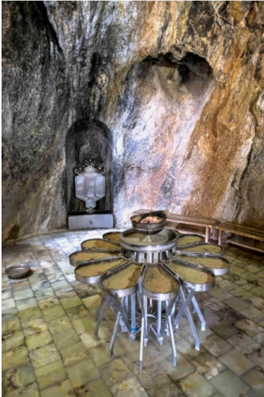
Grotte de Chak Chak