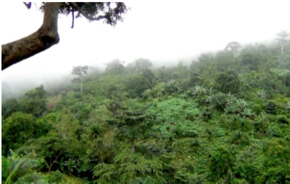
Forêt d'Agomé, Togo

...Que l'on nous dit logiques Ou bien chronologiques.. Tout cela n'est qu'un leurre, Le Réel est ailleurs, Il est illimité, C'est lui l'Eternité !"