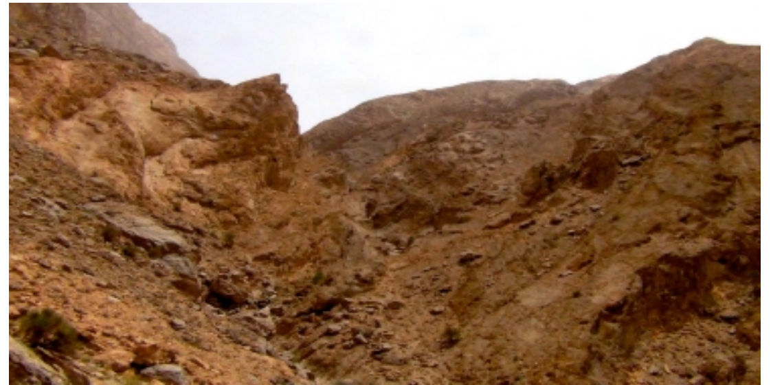
Chak Chak