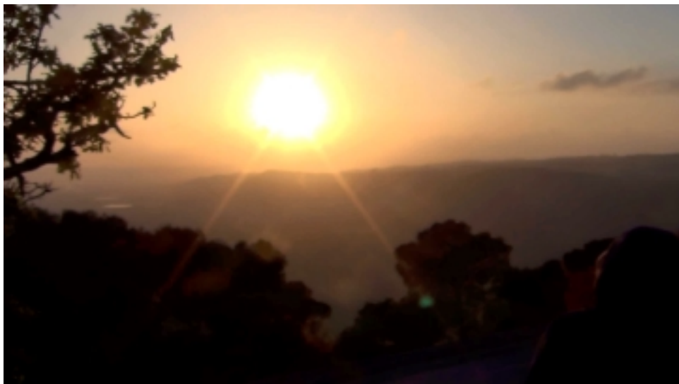
Collines de Nazareth, un soir, au Mont Thabor