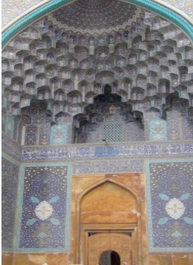
Mosquée, place royale, Ispahan, Iran

(*) "A celui qui, le Premier, par la Pensée, a rempli de Lumière les espaces bienheureux" (Zoroastre 660-580 BC, l'Avesta, Yasna 31)