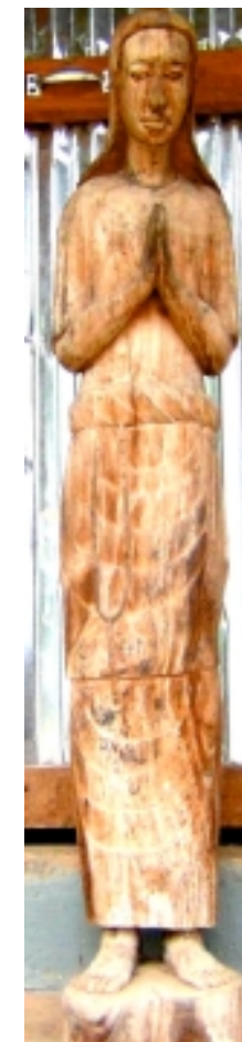
"Soeur Agomé", réchappée d'une église au Togo (Centre artisanal de Kpalimé)

(Orphelinat de Wutegblé, 5 août 2017 Temple d'Agomé, Togo, 6 août 2017)