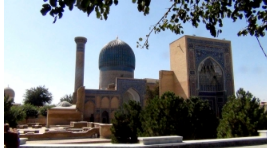
Tombeau et mémorial de Tamerlan à Samarcande

Vendredi 8 septembre : Taschkent – Paris Début de journée à Tashkent. Transfert à l'aéroport et vol direct Tashkent – Paris CDG