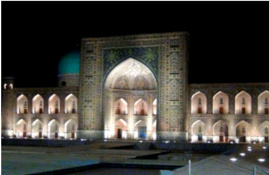
Le Registan à Samarcande de nuit