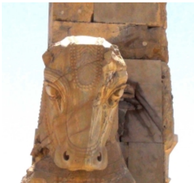
Dans les ruines de Persépolis