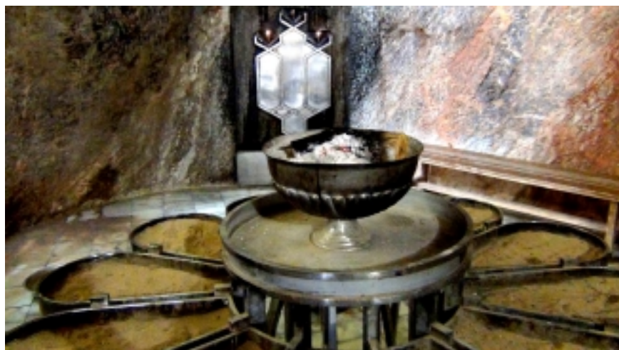
Feu sacré (grotte de Chack Chak, Iran)