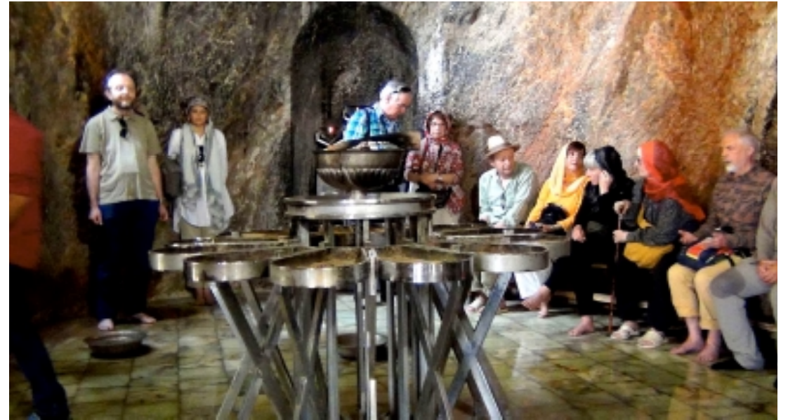
Grotte de Chak Chak (sous réserve accords)