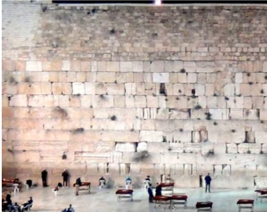
Le Mur