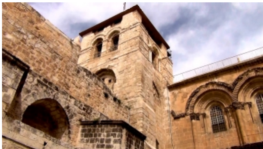
Basilique du St-Sépulcre à Jérusalem