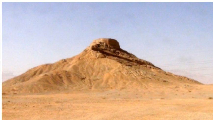
Tour du silence (Yazd, Iran)