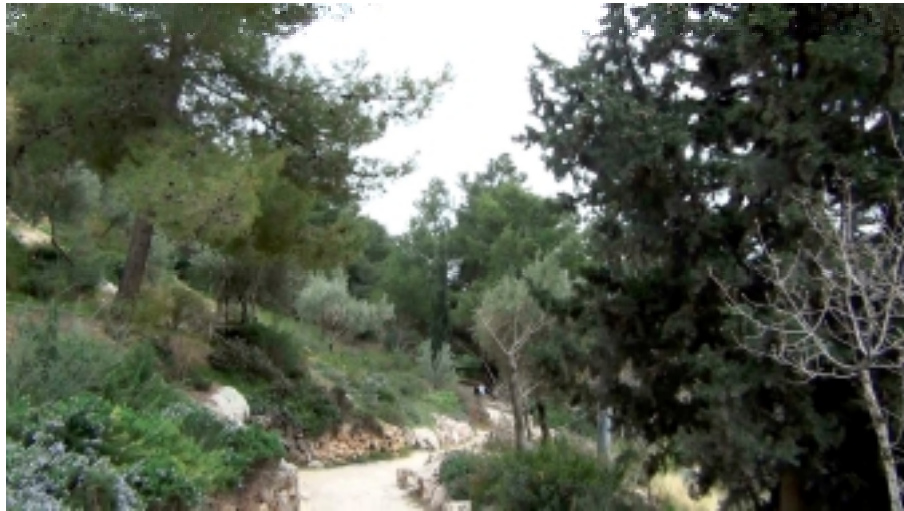
Jardins des Oliviers à Jérusalem