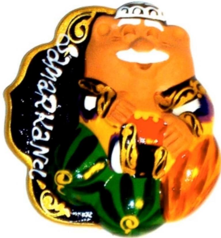
Art populaire chez un artisan à Samarcande, Ouzbékistan