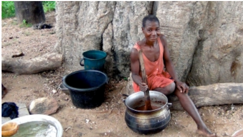
Sous le grand baobab de Kutammaku Tamberma, Togo