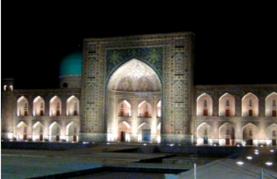
(Dv, la porte des rêves, http://dvinard.chez-alice.fr/reve.pdf )

"Rêver que l'on rêve et rêver encore Que l'on rêve au réel au corps Qui prend son essor, appelant la mort Pour unir le rêve et la flûte au cor !"