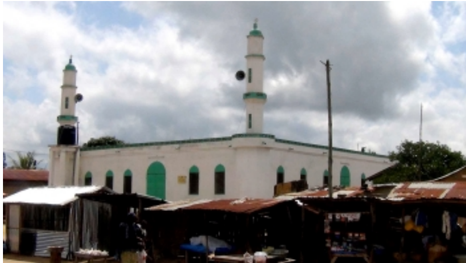
Mosquée à Sokodé Togo