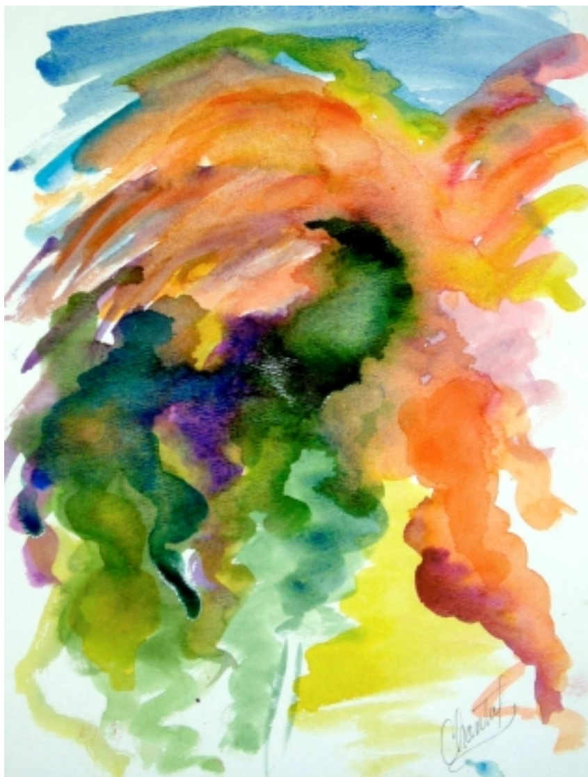
Aquarelle de Chantal Haskew (La Barbeyère, Crest, juin 2005)