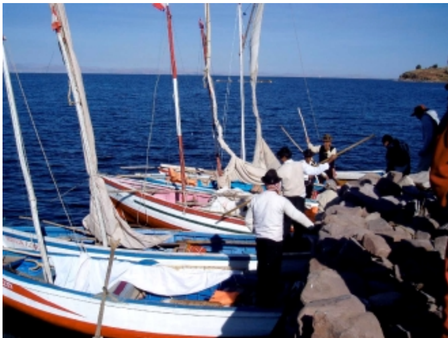
Barques à Taquile sur le lac Titicaca, Pérou

Le poète est semblable au prince des nuées, ... Exilé sur le sol... Ses ailes de géant l'empêchent de marcher ! (Baudelaire 1821-1867, l'Albatros , Morceaux choisis @ Hatier )