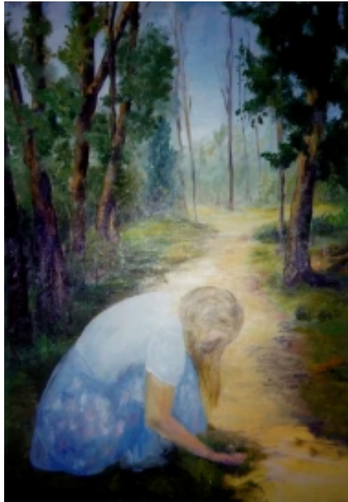
"Le sentier" Huile de Françoise Bousquet (1995)

"Un cavalier mystérieux est passé, un nuage de poussière s'est levé. Il est parti, mais le nuage de poussière est resté. Regarde droit devant toi, pas à gauche ni à droite : Sa poussière est ici : L'homme est ici dans la demeure de l'éternité"