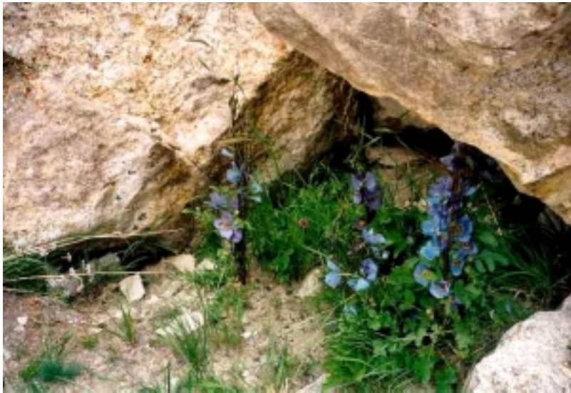
Au bord du chemin, au Zanskar...